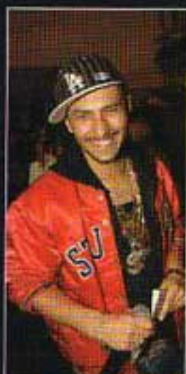
Ведущий презентации Кише