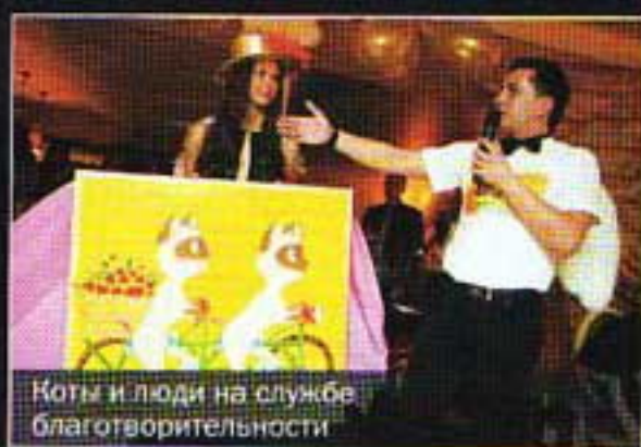
Коты и люди на службе благотворительности