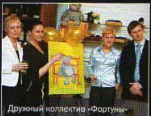
Дружный коллектив «Фортуны»