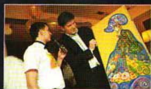
«Венеция» в гостях у «Фортуны»